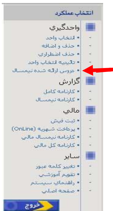
شکل شماره‌ی ۳

۵- پس از ورود به سیستم ثبت نام از ستون سمت راست صفحه‌ی وب ، در بخش انتخاب عملکرد ، در زیر مجموعه‌ی واحدگیری ، بر روی گزینه‌ی دروس ارائه شده نیمسال کلیک کنید. (شکل شماره‌ی ۳)