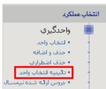
شکل شماره ۱۲

۱۳- پس از انجام مراحل بالا، درستون سمت راست همین صفحه و در بخش انتخاب عملکرد ، در زیر مجموعه‌ی واحدگیری ، بر روی گزینه‌ی تأییدیه‌ی انتخاب واحد کلیک کنید، تا از انتخاب واحد خود مطمئن شوید. (برای راهنمای به شکل شماره ۱۲ توجه کنید). این عمل برای بازیابی کلی اطلاعات ثبت شده‌ی شما ضروری است و حتماً به آن نیاز خواهید داشت.